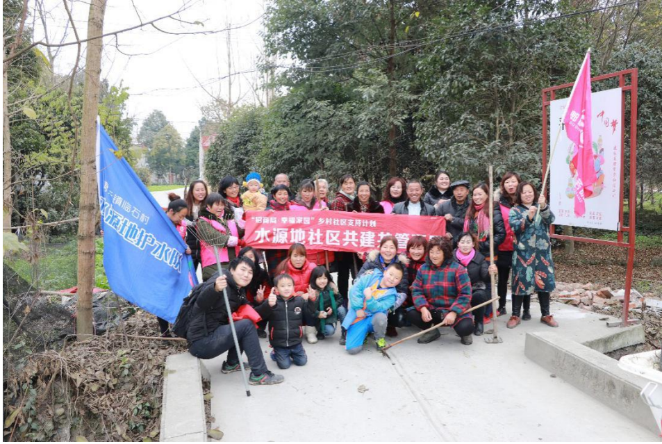
(图 4：水源地社区共建共管项目护水队活动合影)

从行业发展层面看，“幸福家园”不仅瞄准农发社会组织能力提升的需求，整合专业枢纽机构力量，持续支持社会组织学习、实践和相互协作，为行业培养种子机构；还依托枢纽机构及行业平台，推动更多资源和行动者加入农村社区发展领域，提升对该领域的认知和实践水平，推动行业生态的改善。