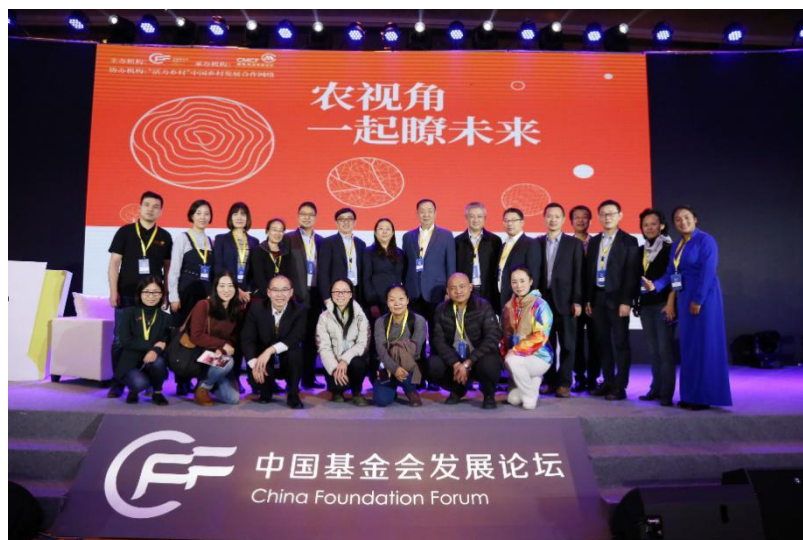
(图 2. 招商局慈善基金会主办“农视角，一起瞭未来”论坛)

从上游看，基于共同的资助经验和对社会发展趋势的共同关注，基金会倾向于以“社会创新”的思路，和行业伙伴交流做事方法、实现知识共享；2018年联合五家乡村发展领域的基金会发起“活力乡村——中国乡村发展合作网络”，以期推动行业发展，更好地激发村庄活力。