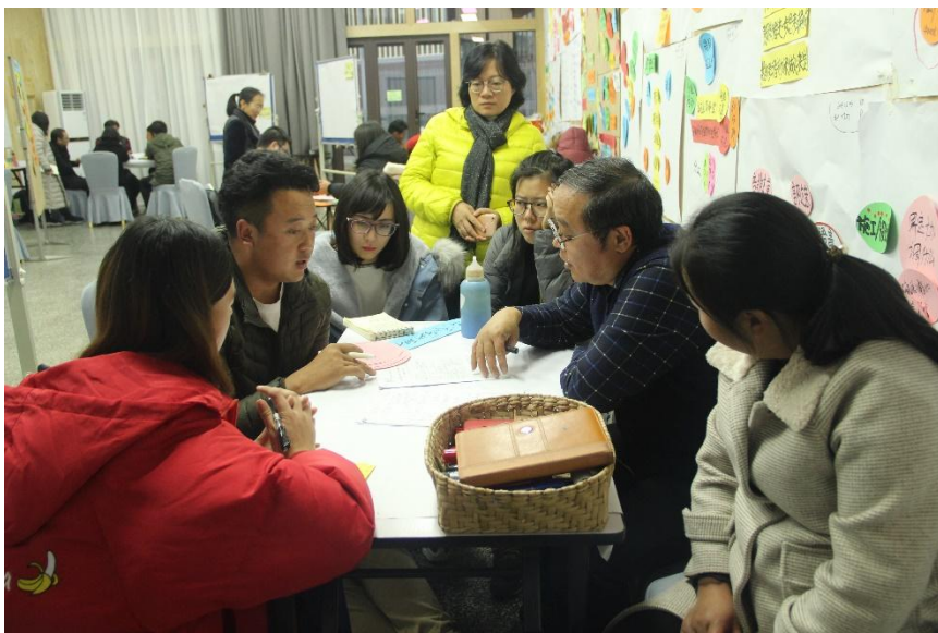
（图 3. 招商局慈善基金会支持成都蜀光社区发展能力建设中心开展对农

以枢纽机构成都蜀光社区发展能力建设中心（以下简称“蜀光”）为例。“幸福家园”支持其利用在农村社区发展领域已形成的“参与式发展”等知识积累，瞄准成长中的社会组织能力不足、项目简单化、资源单一等问题，以提升社会组织参与农村社区发展与治理能力为目标，开展三大版块工作：第一，能力建设培训。包括“参与式方法和社区调查”、“协助者技能和社区组织”、“社区发展项目管理与实施”、“参与式评估”等，紧扣农发社会组织工作及成长需求，层层递进。通过“主题讲解+沙龙讨论+田野实践”等形式，协助社会组织明确角色定位和工作思路，掌握工作方法，打好社区工作基础。第二，种子基金项目。支持部分社会组织在乡村社区开展项目，回应社区需求，边干边学边成长，期间蜀光专家团队提供贴身支持和指导。第三，知识生产。基于“幸福家园”资助经验及蜀光多年积累，项目总结和开发了一套农村社区发展及社区治理相关培训和操作工具，供全行业实践者学习借鉴。未来，蜀光项目培养出的 21 家一线社会组织，将凭借扎实有效的社区工作能力，辐射更多社区，更加有力地开展乡村建设工作。